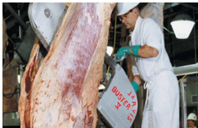
Sierra de Cinta para Corte Buster V Jarvis