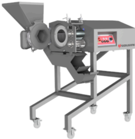
ShreddR® Classic 140