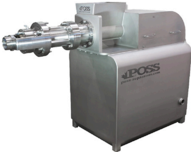
Separador ProMax 3000