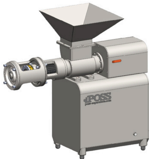
Separador ProMax 1000